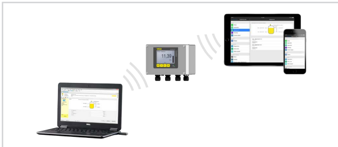
Connexion sans fil au smartphone/à la tablette/à l'ordinateur portable

Le paramétrage est effectué au moyen d'une application gratuite disponible dans "Apple App Store", "Google Play Store" ou "Baidu Store". En alternative, il est possible de procéder au paramétrage aussi via PACTware/DTM et un PC Windows.