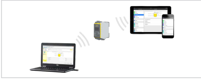
Akıllı telefona/tablete/diz üstü bilgisayara kablosuz bağlantı

Kullanım "Apple App Store", "Google Play Store" veya "Baidu Store" dan ücretsiz olarak yüklenen bir uygulama üzerinden yapılır. Kullanım alternatif olarak PACTware/DTM ve bir Windows bilgisayar üzerinden de yapılabilir.