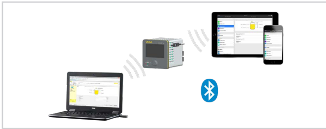
Collegamento wireless a smartphone/tablet/notebook

La calibrazione si esegue con l'app gratuita scaricabile dall'"Apple App Store", dal "Google Play Store" o dal "Baidu Store". In alternativa la calibrazione può essere eseguita anche con PACTware/DTM e un PC con sistema operativo Windows.