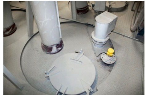
Wie schmal die Silos sind und warum der VEGAPULS 69 mit seinem schmalen Strahlwinkel überzeugt, sieht man auf diesem Foto: Für den Einbau des Messgerätes bleibt kaum Platz.

Sto informierte sich auf dem Markt über verschiedene Systeme. Schnell war klar, dass nur die Radarmesstechnik in Frage käme und man wurde auf den 2014 auf dem Markt eingeführten VEGAPULS 69 aufmerksam. Trotz fehlender Erfahrung mit VEGA baute man das Radarmessgerät Mitte 2015 probeweise ein. Der Radarsensor wird inzwischen in mehr als 10.000 Anlagen weltweit eingesetzt. Sein Pluspunkt ist die hohe Sendefrequenz von 80 GHz und eine Antennengröße von zirka 75 Millimetern mit einem Öffnungswinkel von nur 4°. Dadurch misst der 80 GHz-Strahl an Einbauten oder Anhaftungen an der Behälterwand sicher vorbei.