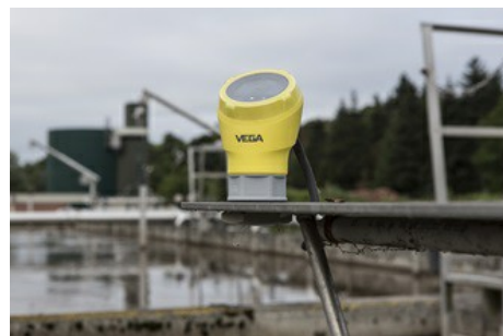
VEGAPULS avec affichage sur site

Cette gamme est parfaitement adaptée à l'industrie des eaux usées , notamment pour la mesure de niveau dans les silos de chaux (produit utilisé pour stabiliser le pH). La mesure effectuée par les capteurs radar reste fiable malgré la poussière dégagée lors du remplissage. Les dépôts présents sur la paroi du silo ou sur le capteur ne posent aucun problème grâce à l'excellente focalisation du signal.