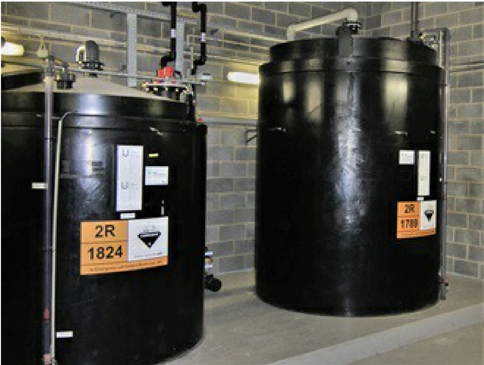
Chemikalienbehälter für die Säure- und Laugenlagerung.

Das britische Belvedere, nahe London, ist Standort einer solchen Müllverbrennungsanlage. Vor Ort befinden sich vier Polypropylentanks mit Natriumhydroxid. Jedes Medium wird hier in einem großen Behälter zur Bevorratung und in einem kleineren Tagesbehälter gelagert, der für die prozesskritische Dosierung und Neutralisation verwendet wird. Alle Tanks wurden ursprünglich über eine kostengünstige Einperlung zur Füllstandmessung geliefert, die aufgrund von Korrosion und Anhaftungen versagte. Dämpfe und Gase entwichen durch die Gehäuse. Darüber hinaus waren die Systeme unzuverlässig, ungenau und sehr unsicher.