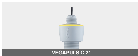
VEGAPULS C 21