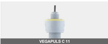
VEGAPULS C 11