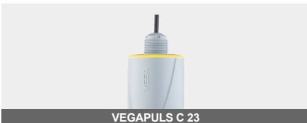
VEGAPULS C 23