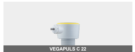
VEGAPULS C 22