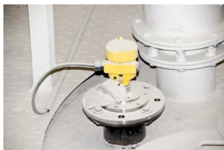
Der VEGAPULS 69 überzeugt durch seine schnelle Messung und die hohe Zuverlässigkeit.