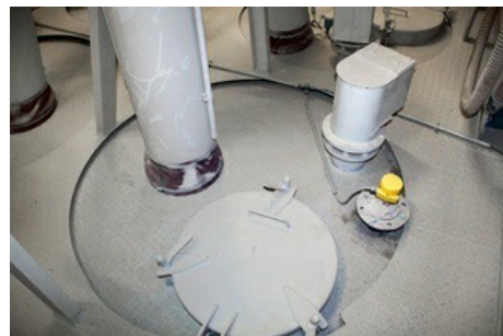
Wie schmal die Silos sind und warum der VEGAPULS 69 mit seinem schmalen Strahlwinkel überzeugt, sieht man auf diesem Foto: Für den Einbau des Messgerätes bleibt kaum Platz.

Sto informierte sich auf dem Markt über verschiedene Systeme. Schnell war klar, dass nur die Radarmesstechnik in Frage käme und man wurde auf den 2014 auf dem Markt eingeführten VEGAPULS 69 aufmerksam. Trotz fehlender Erfahrung mit VEGA baute man das Radarmessgerät Mitte 2015 probenhalber ein. Der Radarsensor wird inzwischen in mehr als 10.000 Anlagen weltweit eingesetzt. Sein Pluspunkt ist die hohe Sendefrequenz von 80 GHz und eine Antennengröße von zirka 75 Millimetern mit einem Öffnungswinkel von nur 4°. Dadurch misst der 80 GHz-Strahl an Einbauten oder Anhaftungen an der Behälterwand sicher vorbei.