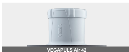
VEGAPULS Air 42