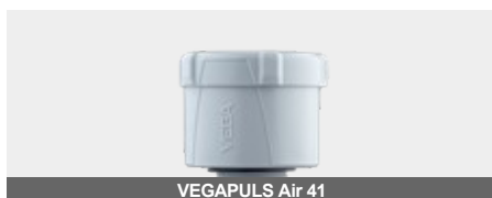
VEGAPULS Air 41