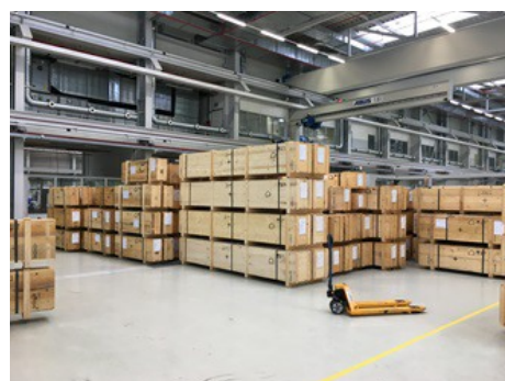
La grande commessa di Linde ha assunto dimensioni gigantesche.

Pressoché ognuno dei 350 strumenti è fornito in una specifica esecuzione. I sensori impiegati nei grandi impianti petrolchimici devono infatti rispondere esattamente alle specifiche esigenze del cliente, fin nei minimi dettagli costruttivi. Perciò quasi 300 dei 350 VEGAFLEX 81 e 86 sono stati realizzati come soluzione completa – confezionati, montati e pronti all'uso – con bypass. Un'altra trentina di sensori in esecuzione speciale sono destinati all'impiego in caldaie a vapore ad alta pressione.