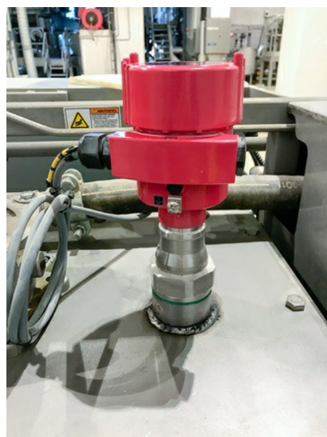
Un détail visible : les capteurs n'arboresent pas le jaune VEGA habituel, mais le rouge typique de Progroup.

En août 2018, les capteurs VEGA ont été installés par l'équipe de l'usine elle-même, et mis en service sans aucun problème grâce au système de paramétrage plics®. Le module de réglage et d'affichage PLICSCOM sert à effectuer la mise en service et le paramétrage des capteurs plics®, puis affiche les mesures. Pas besoin de PC ni de logiciel spécifique. Le module de réglage et d'affichage peut être inséré à tout moment dans le capteur puis retiré sans devoir couper l'alimentation électrique. Avec la nouvelle fonction Bluetooth en option, on peut contrôler le capteur sans fil jusqu'à env. 50 m de distance. Comme l'installation ne nécessite pas de manchon ou accessoire similaire, le coût de montage et de mise en service a également été réduit. Mais le principal avantage de cette solution est certainement celui-ci : grâce à la mesure de niveau sans contact, les éventuelles fuites d'huile sont détectées à temps et peuvent être résolues sans devoir arrêter la machine à papier.