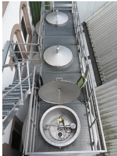
Le capteur radar VEGAPULS 63 sur l'un des tanks de stockage.

Les 14 grands tanks de stockage dans lesquels diverses bières s'affinent sont également équipés de capteurs VEGA. Pendant longtemps, pour la préparation du panaché, le VEGAPULS 63 garantissait l'affichage correct du niveau malgré les obstacles présent dans la cuve comme les buses de pulvérisation, le fond conique et les conduites de pompage. Cependant, les mélanges à base de bière forment souvent une épaisse couche de mousse, ce qui entraînait des imprécisions de mesure. C'est pourquoi VEGA a recommandé le VEGAPULS 64, capteur radar fonctionnant à une fréquence d'émission de 80 GHz avec une focalisation nettement améliorée. Ce nouveau capteur de niveau a convaincu les brasseurs, non seulement par la fiabilité de ses mesures, mais aussi par sa grande précision de +/- 2 mm. En général, les capteurs sont très sollicités dans les brasseries : les tanks sont habituellement nettoyés à froid, mais on utilise parfois de la vapeur. Pour Klaus Vogt et le chef brasseur Ralf Heizmann, les atouts essentiels des capteurs sont leur simplicité et leur fiabilité de fonctionnement, ainsi que leur robustesse.