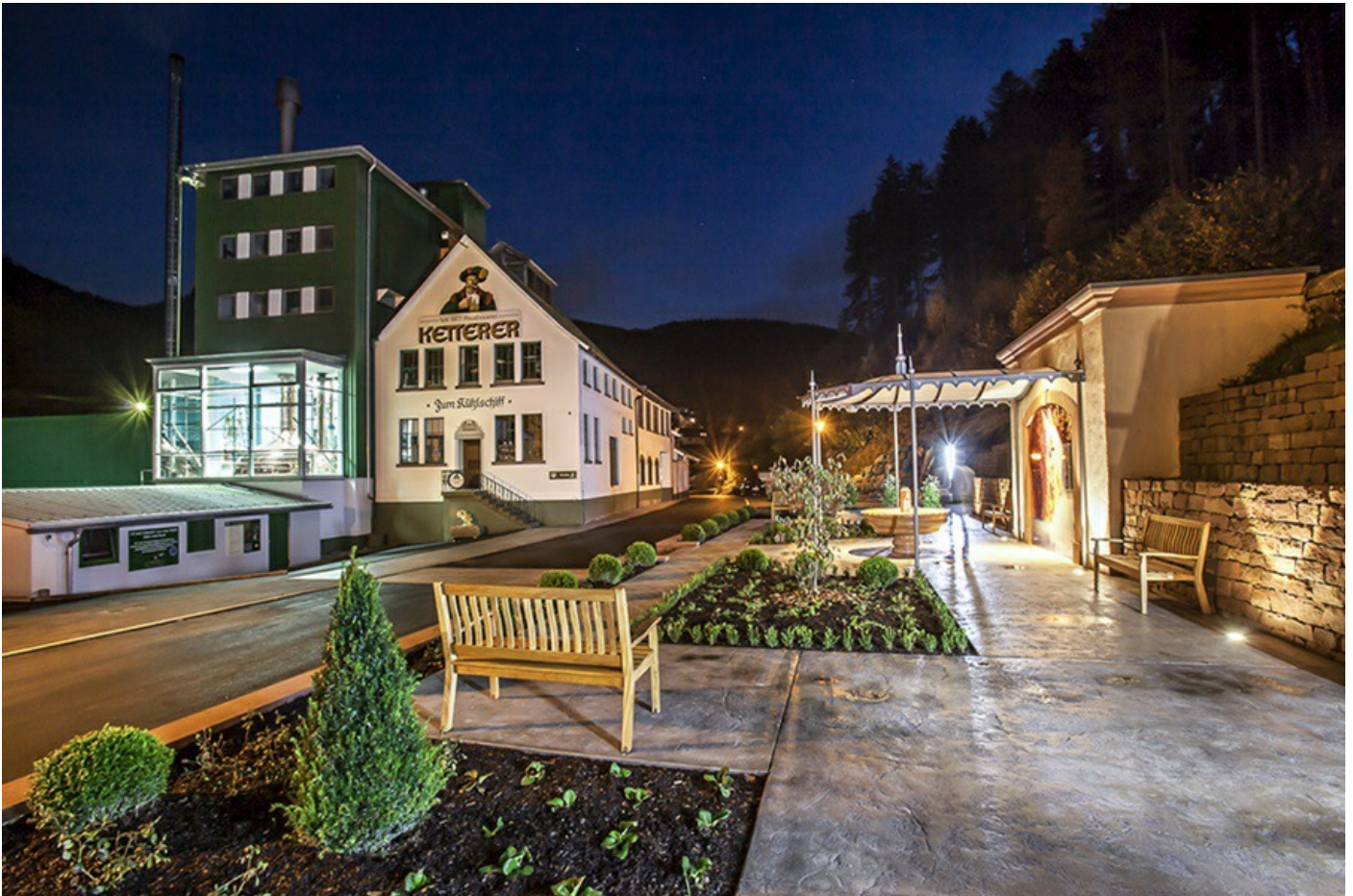
La façade de la brasserie Ketterer à Hornberg.