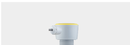
VEGAPULS C 22