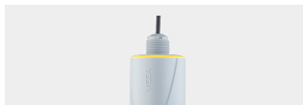
VEGAPULS C 23