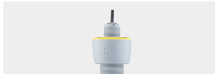
VEGAPULS C 11