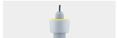
VEGAPULS C 21