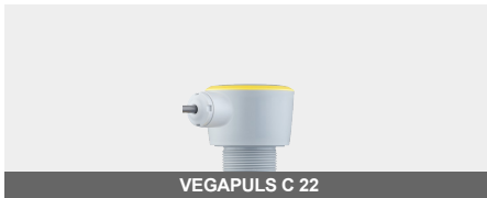
VEGAPULS C 22