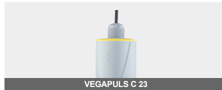
VEGAPULS C 23